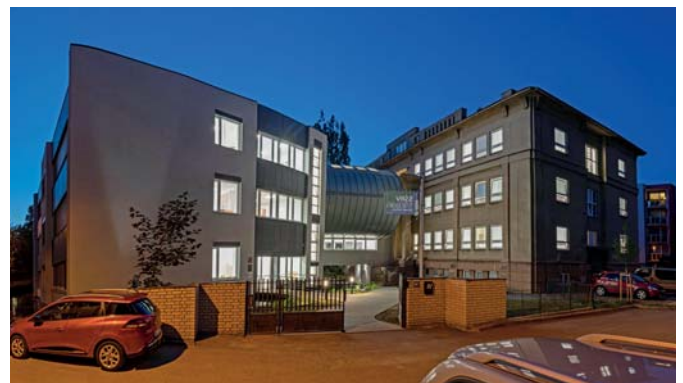
Celkový pohled na zmodernizovanou budovu