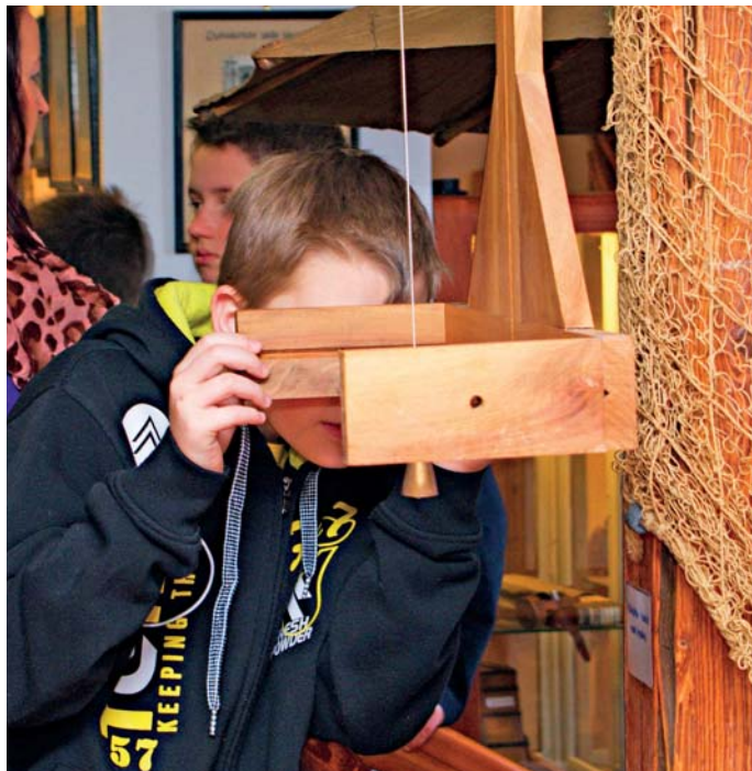
Interaktivní prohlídka muzea

A jak to u nás funguje? Na letní prázdniny přijímáme brigádníky – průvodce (či spíše průvodkyně). Ti se naučí obsah hodinové prohlídky komentovat z manuálu, ale vedeme je k tomu, aby rozsah informací přizpůsobovali skladbě návštěvníků. Často jsou ve skupině například malé děti. Prohlídka zahrnuje ukázky ryb v akváriích. Nádrž je celkem 19 a počet rybích druhů se blíží stovce. Při cestě školou směrem k muzeu a ve vlastním muzeu se již výklad zaměřuje na různé aspekty našeho produkčního i sportovního rybářství. Plánovanou hodinu na prohlídku je někdy docela náročné dodržet, zvláště se zvědavými návštěvníky.