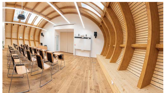
Pohled do nové aule