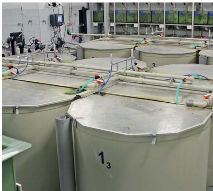
Odchovné a experimentální nádrže

Mimo zmíněná témata probíhají práce na aktivitách v terénu spojených jak s rybníčním chovem a chovem ryb ve speciálních zařízeních, tak i tekoucími vodami. Prakticky na všech aktivitách se podílejí studenti od bakalářského až po doktorský stupeň studia. Zajištění těchto aktivit je možné jen díky finanční podpoře projektů od OP VVV (PROFISH) po NA-ZV nebo GA ČR a skvělé spolupráci s kolegy s dalších vědeckých pracovišť. Podrobnosti k řešeným projektům a dalším aktivitám jsou pro zájemce dostupné na stránkách http://rybarstvi.eu/ .