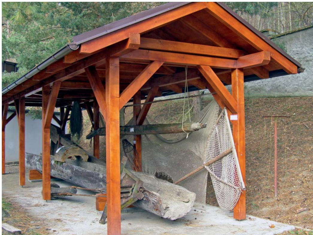
Přístřešek pro rozměrné exponáty

Letošní rok je ve školách velmi atypický, řekněme ne úplně normální. Naši školu z toho nevyjímá. Škola bez žáků je opravdu podivná instituce. Navíc je tu zatím neoslavené výročí školy. Proto nám dělá radost, že můžeme i takto, jiným způsobem, působit na veřejnost a popularizovat náš tradiční obor.