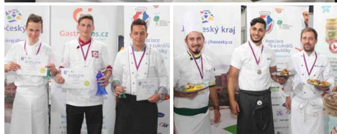
Ocenění kuchařů proběhlo ve dvou kategoriích - junioři, senioři