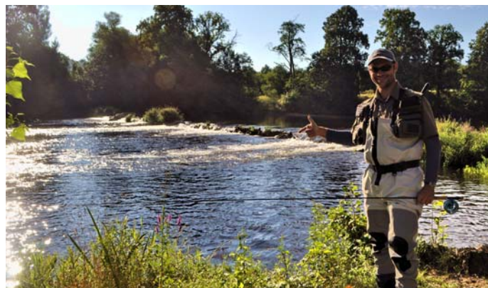
U vody je jako doma...