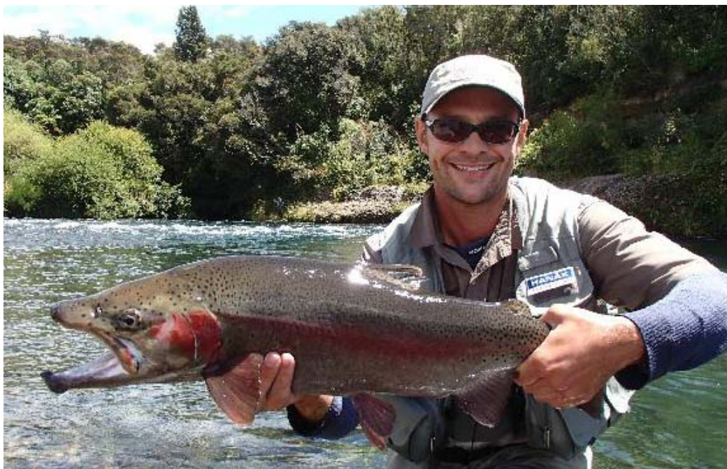
Úlovek pstruha duhového v podání nového jednatele ČRS