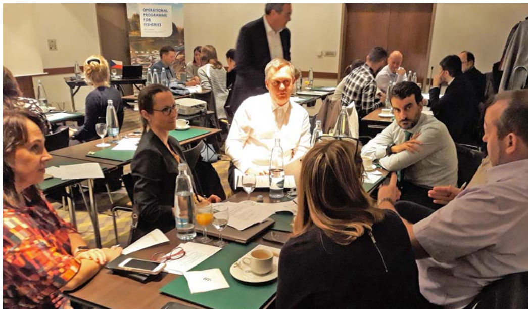
Přítomno bylo 11 členských států