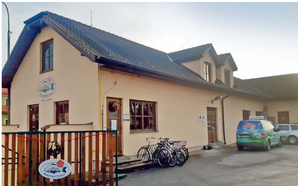
Zpracovna ryb v Třeboni

Zpracovna ryb v Třeboni zpracuje ročně 410t tržních ryb.