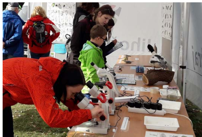
Stánek pro děti na výlovu rybníka Rožmberk připravila FROV JU za podpory Rybářství Třeboň

byl proto o ukázku živých raků spojenou s odborným výkladem zaměstnanců fakulty. Ochuzeni ale nebyli ani dospělí návštěvníci, kteří si mohli odnést drobné upomínkové předměty, nástěnný rybářský kalendář či pořídit odbornou rybářskou literaturu z fakultního e-shopu. Ke spokojenosti všech opět perfektně vyšlo počasí, což přispělo k nádherné atmosféře této akce. Pochvalu si zaslouží především podnik Rybářství Třeboň, a.s., jehož zaměstnanci akci perfektně organizačně zvládli a tak opět přispěli k dobrému jménu českého rybářství.