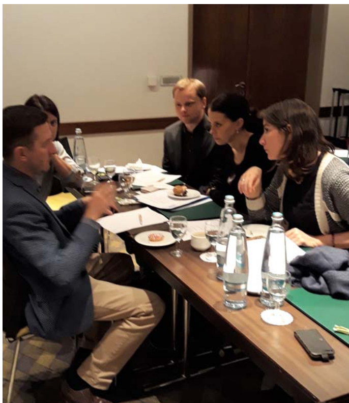
Tématem diskuze byla strategie akvakultury v příštím programovém období

států navštívili největší český rybník Rožmberk. Setkání bylo velkým přínosem pro členské státy a poukázalo na jedinečnost tradičního rybníkářství v ČR a zemích bez mořského rybolovu.