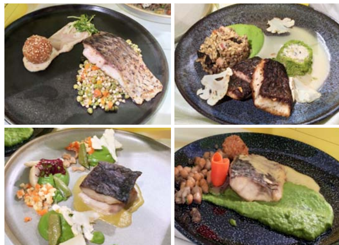
Ukázka soutěžních pokrmů