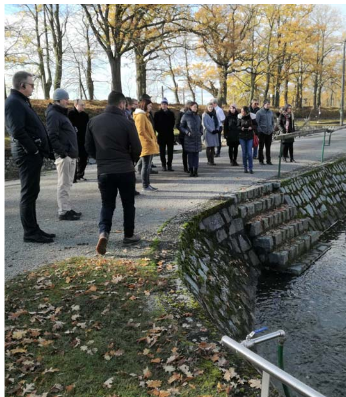
Návštěva sádek Šaloun v Lomnici nad Lužnicí