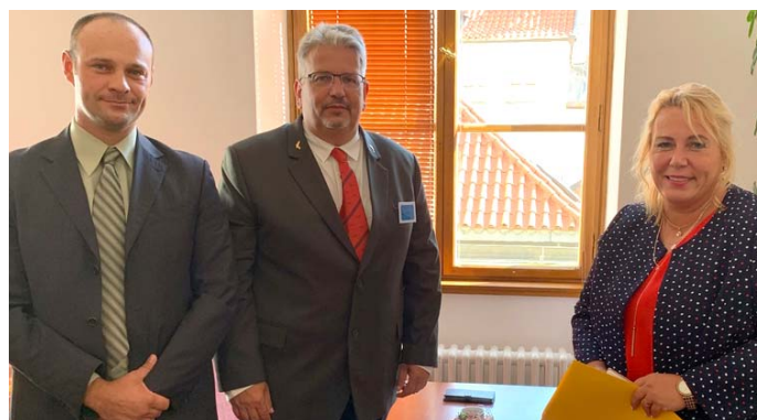
Setkání jednatele a předsedy svazu s ministryní Klárou Dostálovou

Ryby připravuji a jím moc rád a poměrně často. Mám rád pstruha, dravé ryby, ale hodně si pochutnám i na kaprovi, nebo občas na mořské rybě. Nejzásadnější věc, co se týče konzumace ryb, je čerstvost. Tvrdím, že čerstvá ryba nepotřebuje moc koření ani složitou přípravu, a tak si většinou vystačím jen se solí, pepřem, trochou citrónu a olivovým olejem.